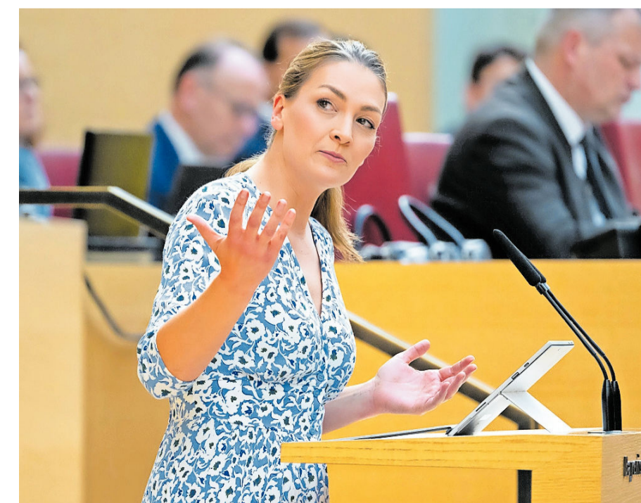
Digitalministerin Judith Gerlach bei ihrer ersten Regierungserklärung im Landtag. Sie spricht von „Hightech und Heimat“ – wie der Chef.

men, für die im Haushalt 2023 etwa eine halbe Milliarde Euro hinterlegt seien. Gerlach sagt, das seien oft „nicht die fancy, abgehobenen Themen, sondern wir verbessern konkret den Alltag der Menschen“. Ein paar Schlaglichter: Für digitale Einstiege, etwa Senioren, richtet man in 30 Kommunen Anlaufstellen für Fragen zu Smartphone und Internet ein. Wie bucht man online einen Arzttermin? Um solche Sachen